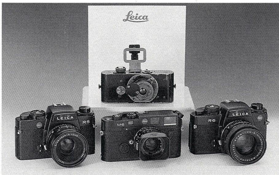
Una idea che dura da 75 anni: la Ur-Leica del 1914 con i modelli di oggi, R5, M6 ed R6.