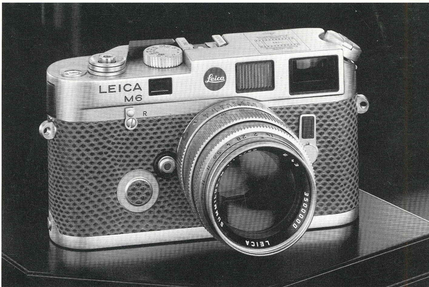
Ecco le due Leica commemorative del doppio anniversario 1989: sopra la M6 platinata costruita in 1250 esemplari e sotto la R6 platinata, costruita in esemplare unico e venduta all'asta di Londra ad un prezzo di circa 50 milioni.