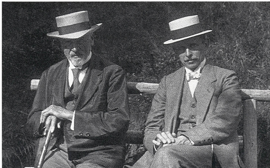
Un ricordo di Ernst Leitz I e di Oskar Barnack fotografati con la Ur-Leica nel 1914.

La Leica, la piccola macchina di Barnack ha finito per dare il suo stesso nome non solo alla fabbrica che la produce, ma anche alla multinazionale che è stata creata di recente con la fusione tra la Wild Leitz Holding Ltd. svizzera e la Cambridge Instruments plc inglese. Il che lascia bene sperare per gli anni a venire.